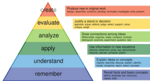
Figura 2: Taxonomia de Bloom.

O aprendizado é consolidado por meio da experimentação e criação de circuitos digitais e técnicas de sistemas operacionais modernos.